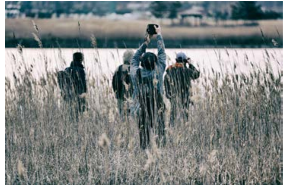
2015. 3. 14 소래습지생태공원 출사

경기도 고양시 일산동구정발산동 양지마을 3단지 308-201 010-3227-6916 kyparis01@daum.net www.quattro-art.com