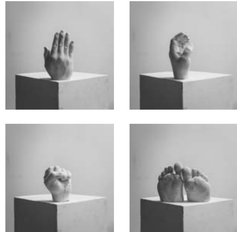
Equivalent series 30 x 30cm, C-print